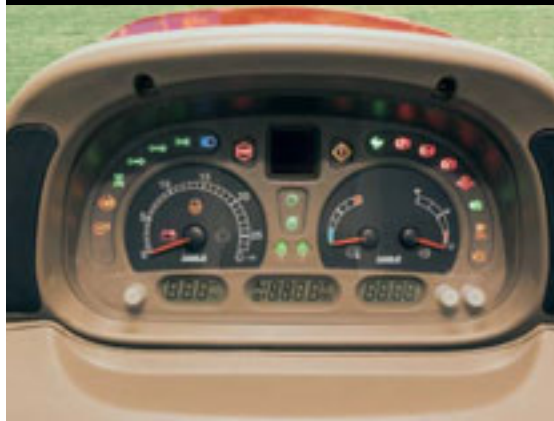
Tableau de bord Maxxum X - line avec moniteur de performance en option pour visualiser l'état de fonctionnement en un coup d'oeil.

Volant réglable - une position de conduite toujours correcte.