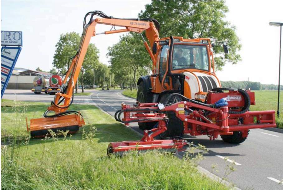
Stufenlos im Kommunalbetrieb: Der neue Steyr CVT Trac Kommunal ist äußerst flexibel einsetzbar