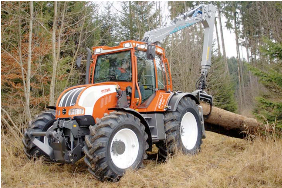
Der neue Steyr CVT Trac Forst bietet mit 4 Anbau­räumen ungeahnte Möglichkeiten im täglichen Einsatz