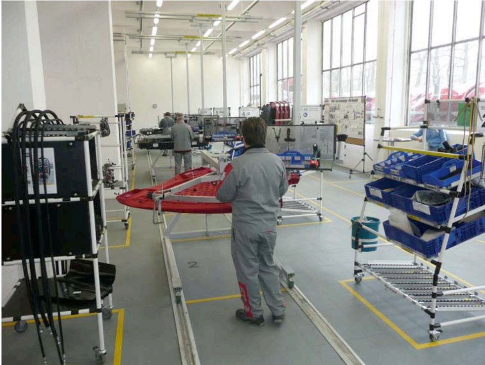
Ende der Kurzarbeit in der Produktion von St. Valentin.