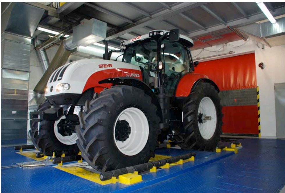
Qualitätsoptimierung – wie hier durch den neuen Rollenprüfstand – wird in St. Valentin groß geschrieben.